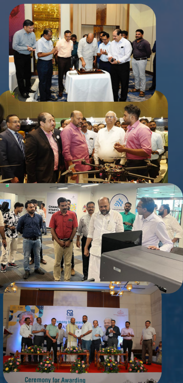
Ceremony for Awarding