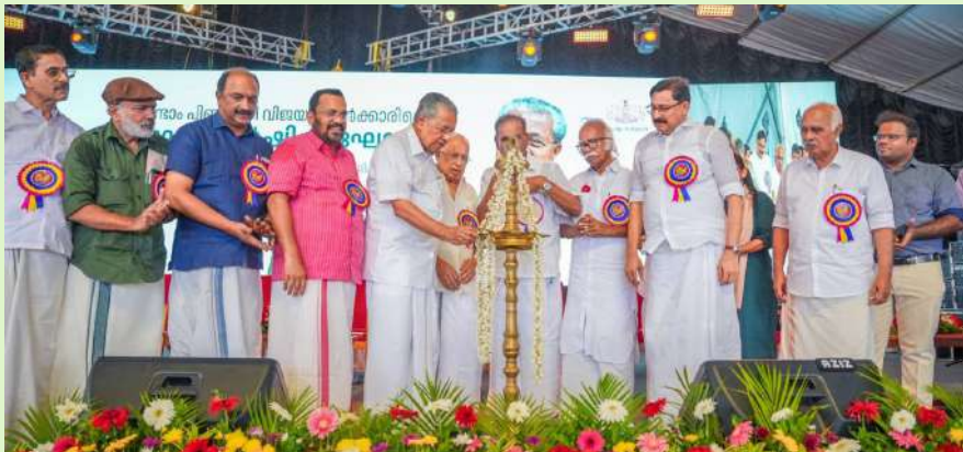
എന്റെ കേരളം പ്രാർത്ഥന വിപണന മേളയുടെ ഉദ്ഘാടനം ബഹു. മുഖ്യമന്ത്രി നിർവ്വഹിക്കുന്നു..

സ്ഥാന സർക്കാരിന്റെ നാലാം വാർഷികാഘോഷങ്ങളുടെയും 'എന്റെ കേരളം' പ്രാർത്ഥന വിപണനമേളയുടെയും സംസ്ഥാനതല ഉദ്ഘാടനം 2025 ഏപ്രിൽ 21 ന് കാസർകോട് കാലിക്കടവിൽ ബഹു. മുഖ്യമന്ത്രി ശ്രീ. പിണറായി വിജയൻ ഉദ്ഘാടനം ചെയ്തു. 2025 ഏപ്രിൽ 21 ന് തുടങ്ങിയത് 24 വരെ സംഘടിപ്പിക്കുന്ന നാലാം വാർഷികാഘോഷത്തിൽ 40 ദിവസത്തെ പരിപാടികളാണ് ഒരുക്കിയിട്ടുള്ളത്. വെറും ആഘോഷ പരിപാടികൾക്ക് അപ്പുറം കേരളത്തെ ഇനിയും ഉൾജ്ജ്വലമായി മുന്നോട്ട് നയിക്കാനും ജനകീയ ഇടപെടലിന്റെ സാധ്യതകളെല്ലാം എല്ലാ മേഖലകളെയും ഉണർവിന്റെ ഭാഗമാക്കാനും ഉതകുന്ന വിധമാണ് പരിപാടികൾ ആസൂത്രണം ചെയ്തിട്ടുള്ളത്. വാർഷികാഘോഷത്തിന്റെ ഭാഗമായി എല്ലാ ജില്ലയിലും ബഹു. മുഖ്യമന്ത്രി പങ്കെടുക്കുന്ന യോഗവും പ്രാർത്ഥന വിപണന മേളയുമുണ്ടാകും. തിരുവനന്തപുരത്താണ് സമാപനം.